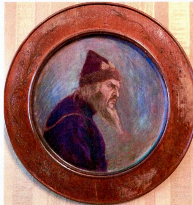
Картина подарена автору Шаляпиным

певцам, у которых всё направлено на искусство давать звук и только, для которых речитатив труден, а целая партия, построенная на речитативе – настоящий камень преткновения. Ясно, почему эта опера даётся так исключительно редко, даже на родине её написания.